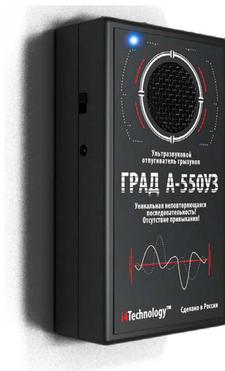
Рисунок 1 – внешний вид прибора

1.2.1 Внешний вид изделия представлен на рисунке 1